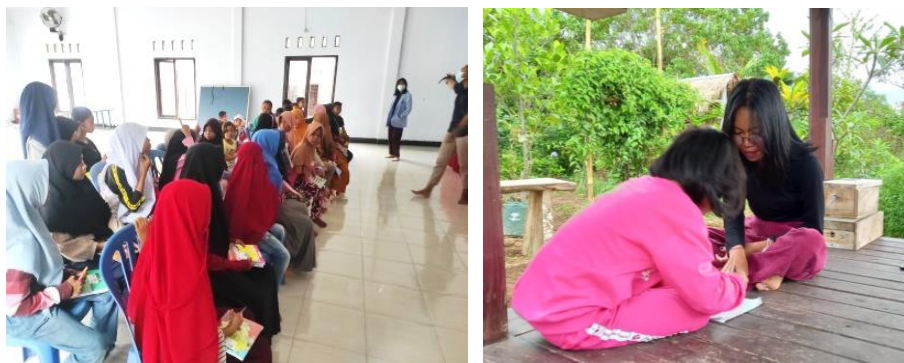
Gambar 2. Kegiatan Pelatihan di Dusun Nyurbaya Gawah

Gambar 2 berikut bagian dari kegiatan pelatihan program Improving Language And Communication Skill pada salah satu kondisi kegiatan yang sudah berlangsung.