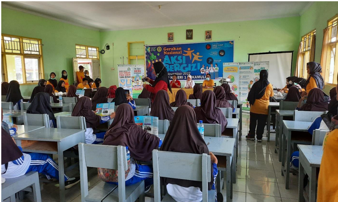
Gambar 2. Sosialisasi tentang jenis-jenis bahan makanan serta kandungan gizi