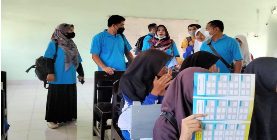
Gambar 4. Koordinasi untuk dilakukannya pemantauan status gizi siswa

Hasil yang sudah di capai dalam pelaksanaan kegiatan KKN, sebagai berikut: (1) Melaksanakan program terpadu antara Tim KKN, Mitra KKN dan Sekolah SMPN I Sukamulia untuk melaksanakan dan meningkatkan program Gizi bagi peserta didik dalam rangka memperbaiki Status Gizi Siswa; (2) Penerapan Perilaku Hidup Bersih dan Sehat (PHBS) serta mengkonsumsi makanan sehat dengan gizi seimbang mulai dari Peserta KKN, Mitra KKN dan pihak sekolah; (3) Adanya komitmen pengelola kantin sekolah untuk berperan serta aktif dengan menjual makanan dan jajanan yang sehat untuk siswa; (4) Adanya komitmen pihak sekolah untuk menambah jumlah sarana cuci tangan bagi siswa; dan (5) Melakukan penyuluhan tentang status gizi siswa untuk meningkatkan pengetahuan peserta didik tentang pola makan sehat dengan gizi yang seimbang.