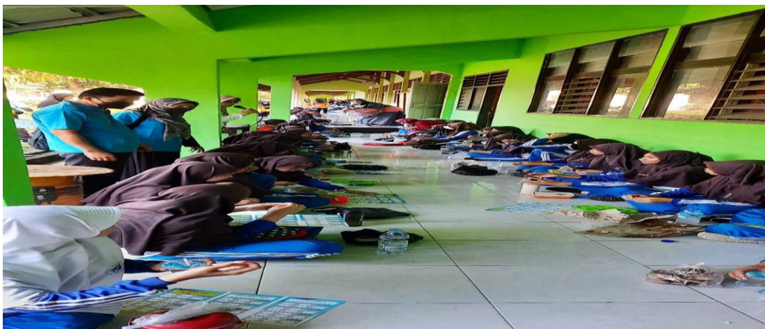
Gambar 3. Sosialisasi tentang mengatur pola makan serta aktifitas olahraga