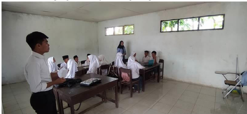
Gambar 3 Observasi Permasalahan Siswa

Kegiatan kedua adalah Observasi dan mengidentifikasi masalah yang ada pada siswa didalam kelas terkait pengetahuannya tentang computer dan Microsoft Office Word.