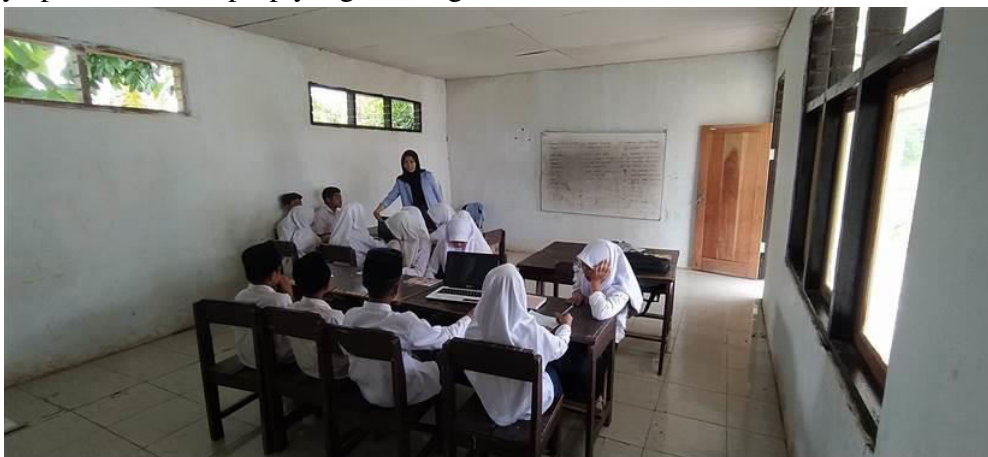
Gambar 4. Persiapan Pelatihan Komputer

Kegiatan Ketiga adalah persiapan pelatihan untuk siswa . Pada kegiatan ini peneliti telah menyiapkan 2 buah laptop yang akan digunakan oleh siswa-siswi .