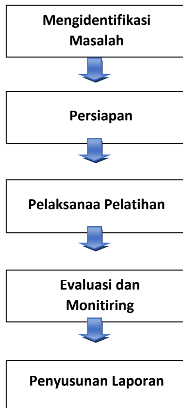
Gambar 1. Sususan Tahapan Pelaksanaan Kegiatan