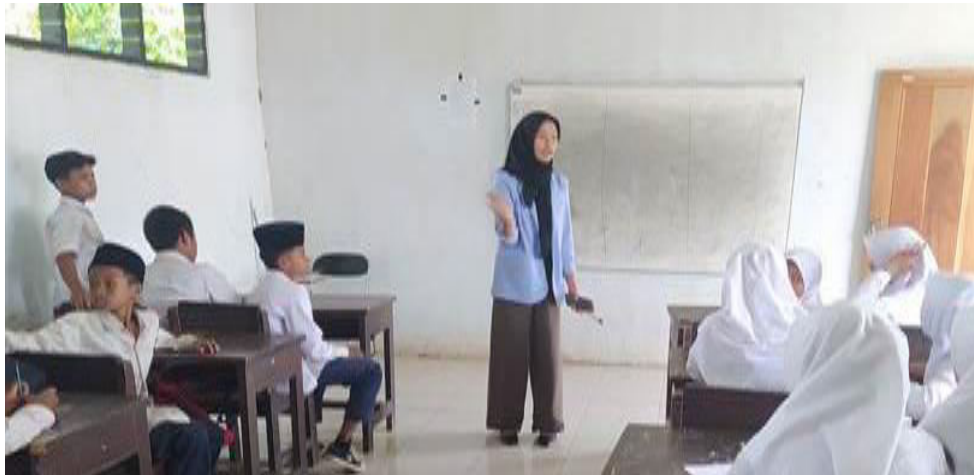
Gambar 2 Perkenalan dan Wawancara

Kegiatan kedua adalah Observasi dan mengidentifikasi masalah yang ada pada siswa didalam kelas terkait pengetahuannya tentang computer dan Microsoft Office Word.