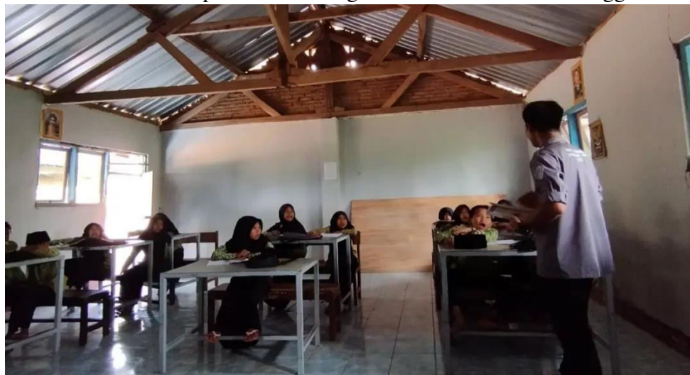
Gambar 2. Tahap perkenalan

Berdasarkan tahapan – tahapan kegiatan diatas. Kegiatan pertama pada pelatihan ini adalah perkenalan dan wawancara kepada siswa mengenai Dasar-dasar bahasa Inggris