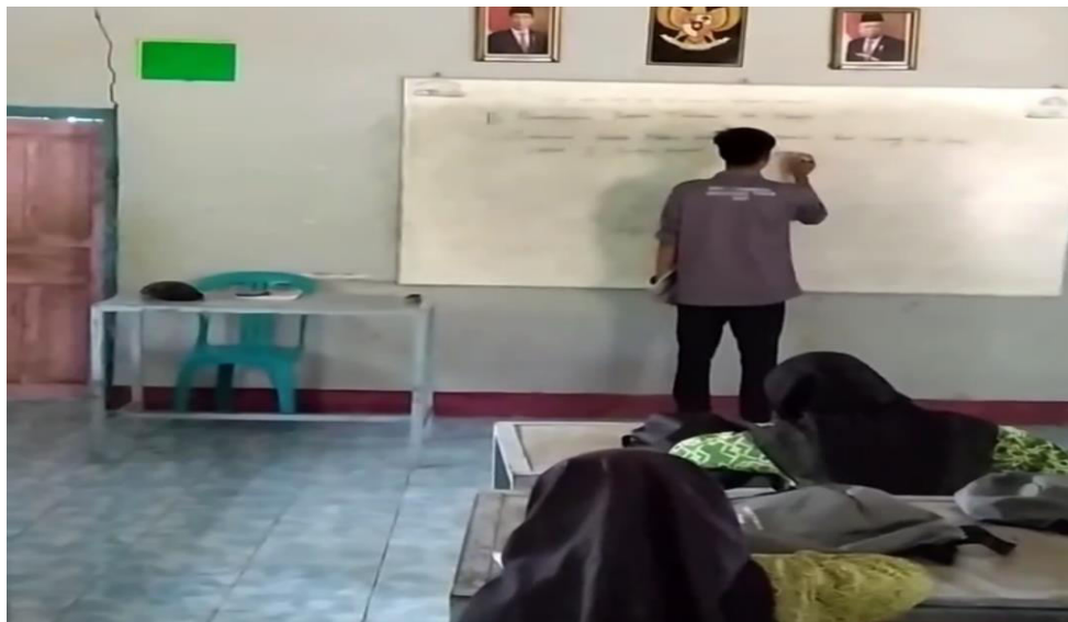
Gambar 4. Penyampaian materi kepada siswa

Kegiatan Ketiga adalah persiapan pelatihan untuk siswa yang telah disiapkan oleh peneliti. Pada kegiatan ini peneliti telah menyiapkan materi yang akan menjadi syarat utama kemampuan siswa-siswi .