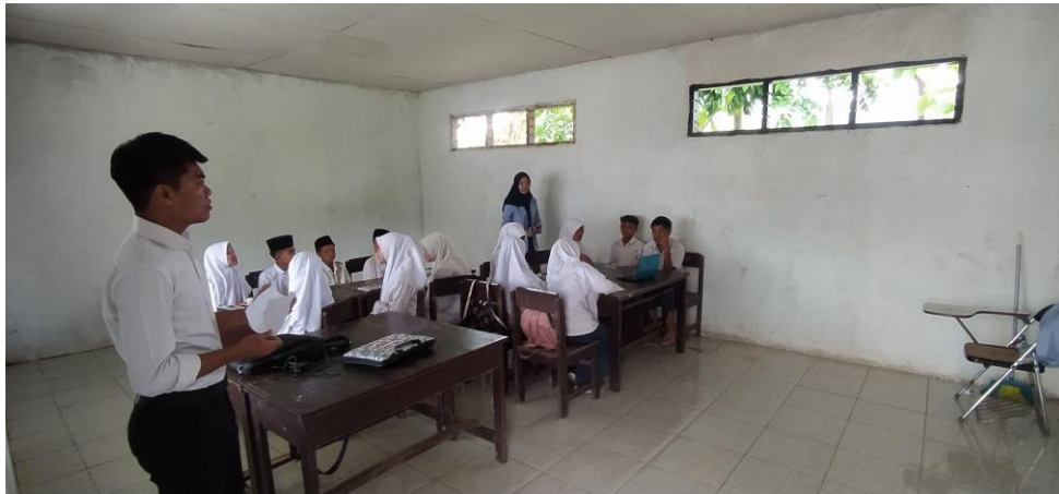
Gambar 3. Observasi masalah yang dihadapi oleh siswa

Kegiatan Ketiga adalah persiapan pelatihan untuk siswa yang telah disiapkan oleh peneliti. Pada kegiatan ini peneliti telah menyiapkan materi yang akan menjadi syarat utama kemampuan siswa-siswi .