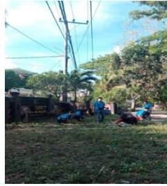
15. Pemasangan rambu-rambu evakuasi